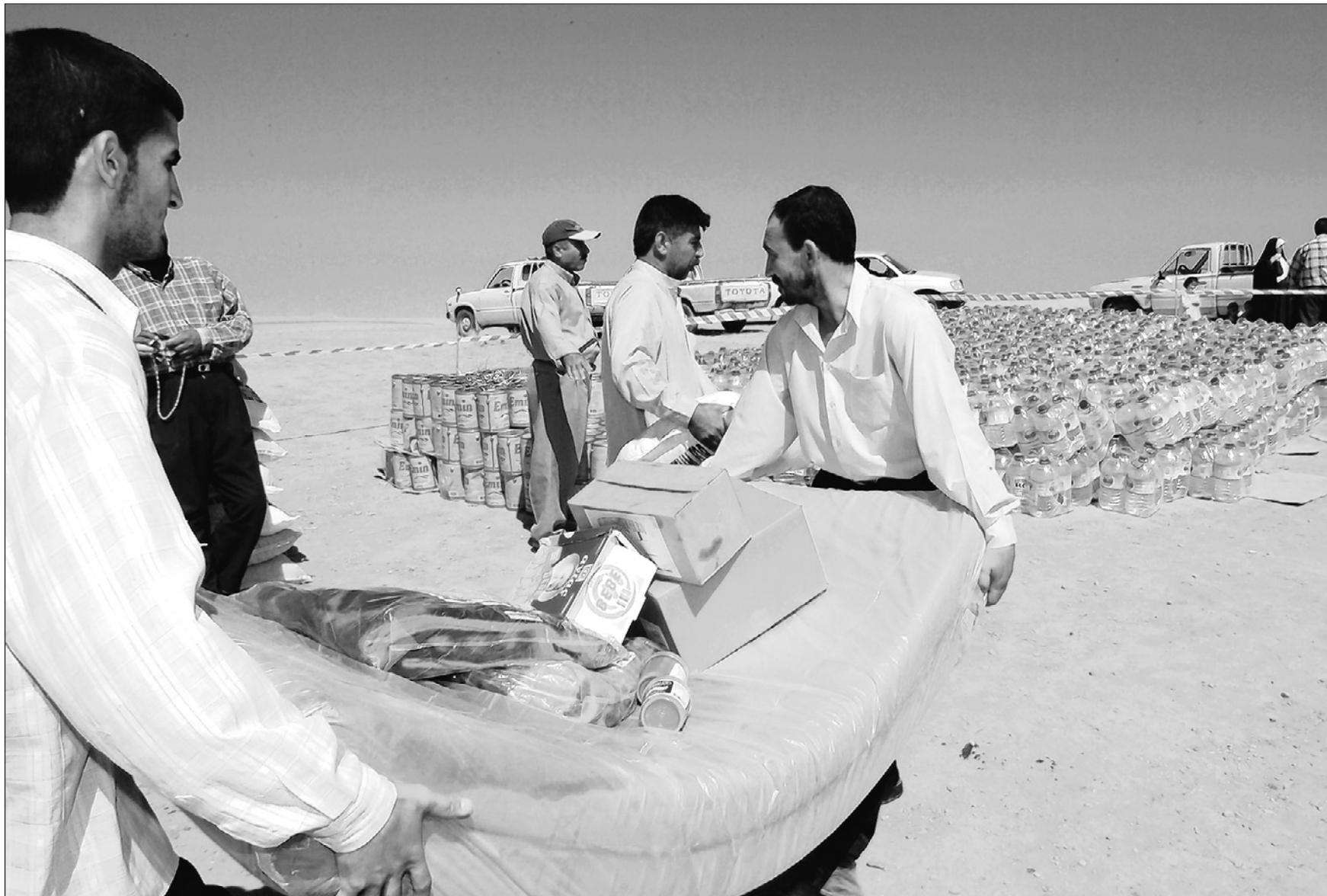
Postenlauf Die Hilfsgüter sollen den zurückkehrenden kurdischen Flüchtlingen einen neuen Start in der alten Heimat ermöglichen.

Flüchtlinge kehren nach Jahren der Verfolgung und Umsiedlungspolitik in ihre Dörfer zurück