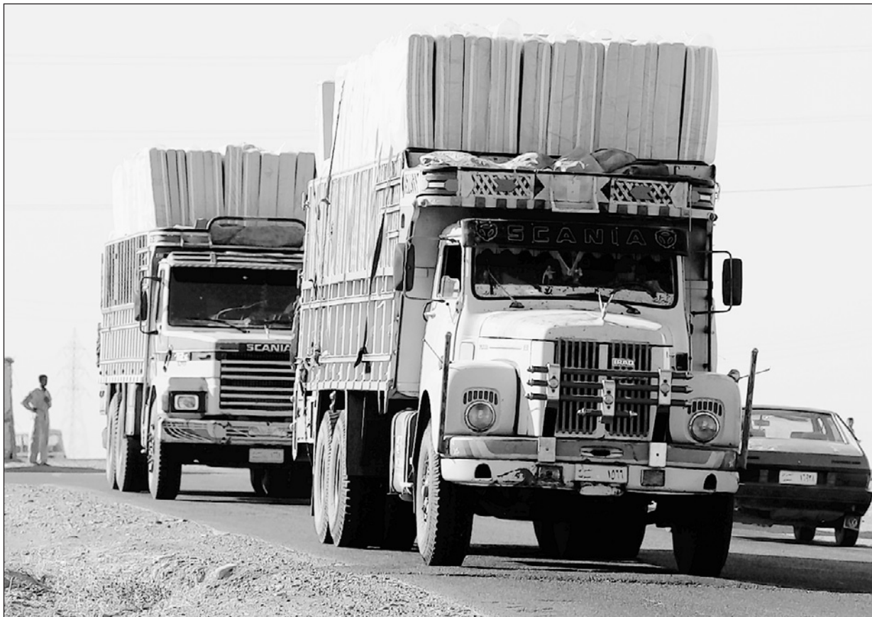
Unterwegs Kurdische Lastwagen, beladen mit türkischen Hilfsgütern, finanziert aus der Schweiz. ROBERT HANSEN